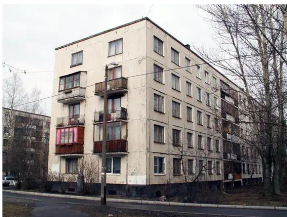
Д) ЖК Садовые кварталы