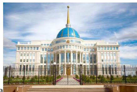
Д) Резиденция Акорда