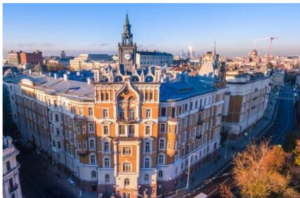
С) Панельная хрущевка