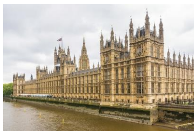
С) Дом Басина