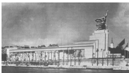
D) Павильон Эспри Нуво