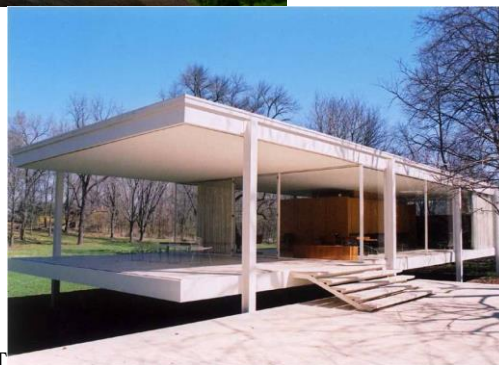
В) Дом Фарнсуорт