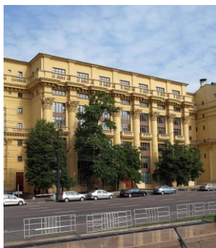
Д) Дом Наркомфина