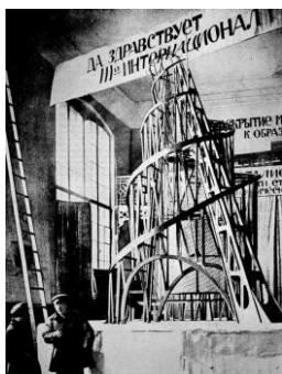
В) Здание Московского университета