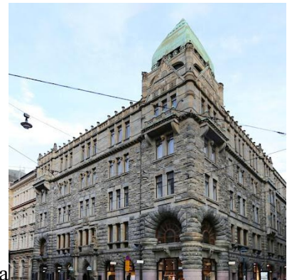
A) Дом компании Pohjola