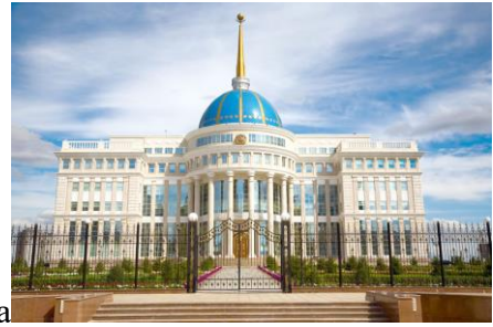
D) Резиденция Акорда