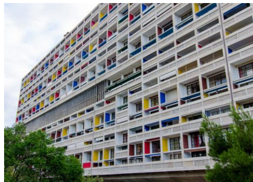
A) Жилая единица в Марселе