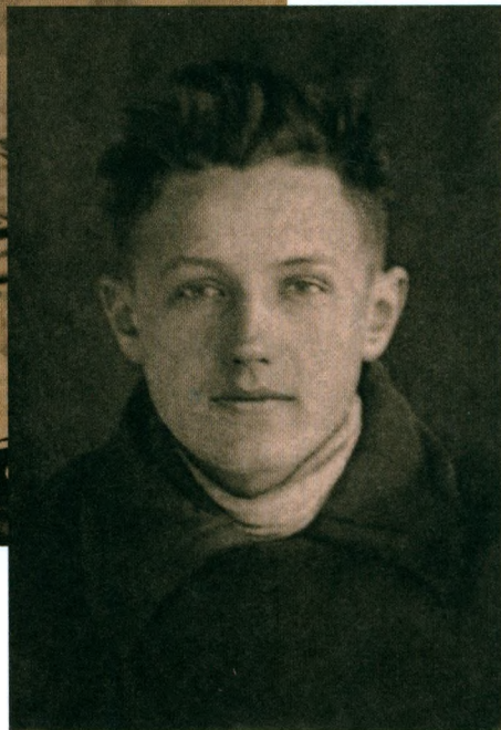
Алесь Адамович. 1944

1945 В Глуше экстерном сдает экзамены за среднюю школу. Поступает в Белорусский государственный университет (БГУ), оканчивает по специальности «филолог» (1950).