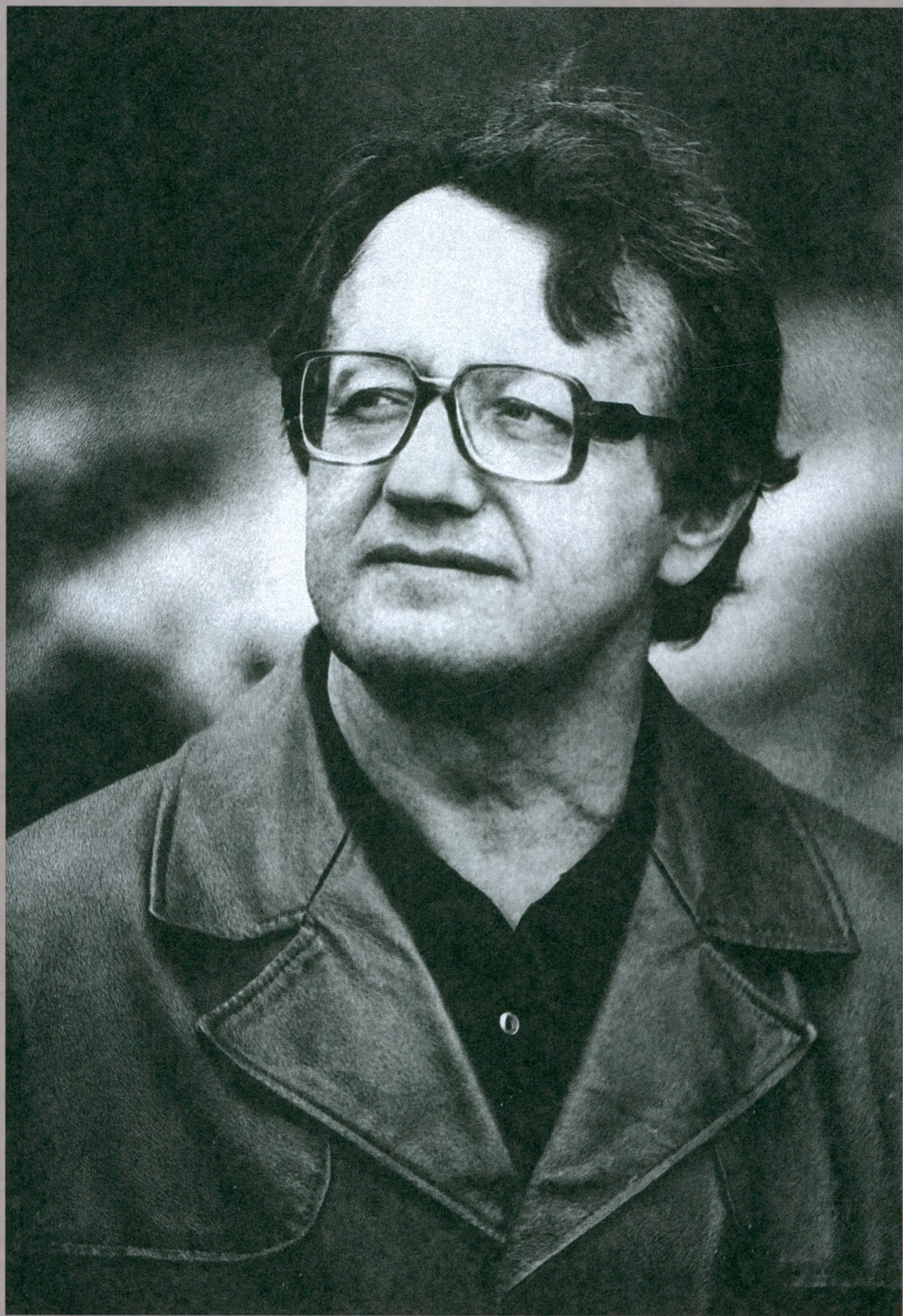
Алесь Адамович. 1984