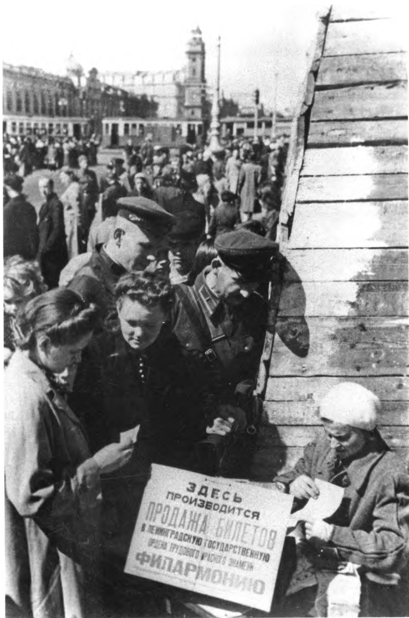
Продажа билетов в Филармонию на Невском проспекте в июне 1942 г.