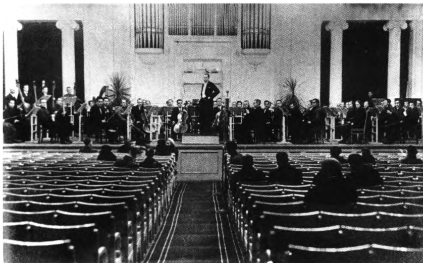
Репетиция в Большом зале Ленинградской филармонии. 1942.