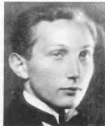
Эгон Редлих. Фото, 1937. БТ.

Почему мы выбрали такой путь и почему сочли его наиболее подходящим? Во-первых, собранные в гетто люди представляли собой неорганизованную массу. Во-вторых, семьям не разрешали быть вместе, мужья и жены жили в разных помещениях. Среди других причин – коллективный порядок хозяйственной и общественной жизни гетто; недостаток продуктов питания привел к нормированию питания; недоставало одежды и прочих вещей. В детских домах мы смогли улучшить снабжение одеждой, отопление,