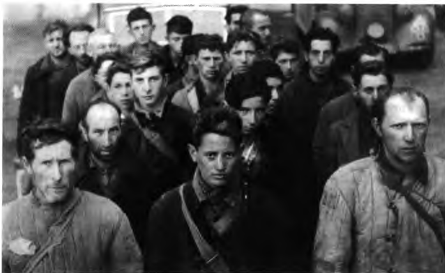
Первые месяцы войны. Латвия, Литва, Эстония