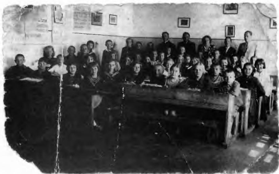
Предвоенная фотография учеников 5 класса «А» в украинском местечке. За партами немало еврейских детей, дни которых сочтены

В западных районах СССР многие евреи жили в местечках и в небольших городках, откуда не было практически никакой организованной эвакуации. Мужчины ушли в армию в первые дни войны, оставались женщины, старики и дети, которые не решались тронуться в путь. Еврейские семьи были многодетными, что также не способствовало передвижению, а вид беженцев из приграничных районов «наводил на мысль, что лучше оставаться на своем месте, чем ехать куда-то голодать и сидеть на холоде». Одни не хотели покидать дома, где они родились, состарились, нажили имущество за долгие годы; другие считали, что война продлится недолго – следует переждать несколько дней, придут русские танки и прогонят немцев; третьи не знали за собой никакой вины: «Мы политикой не занимаемся. Работали и дальше будем работать. Никто нас не тронет: не за что». Было и немало фаталистов, которые отказывались принимать какое-либо решение: «Что станет с людьми, то и с нами». И еще одно, немаловажное. Еврейские общины прежних времен со своими руководителями и духовными лидерами, отличавшиеся солидарностью в трудные моменты жизни, уже не существовали, и каждый был предоставлен самому себе, собственному выбору – уходить или оставаться на месте.