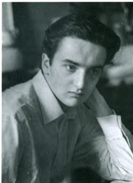
В студенческие годы