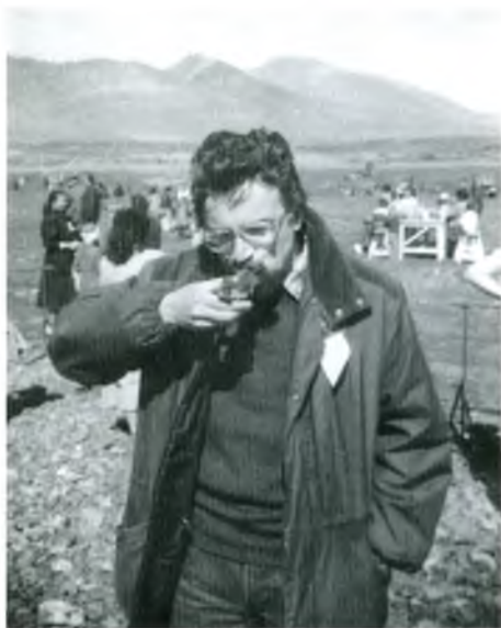
Вторая экспедиция. Вошел во вкус полевой работы. «Праздник кита» в селе Новое Чаплино. Лето 1977 года