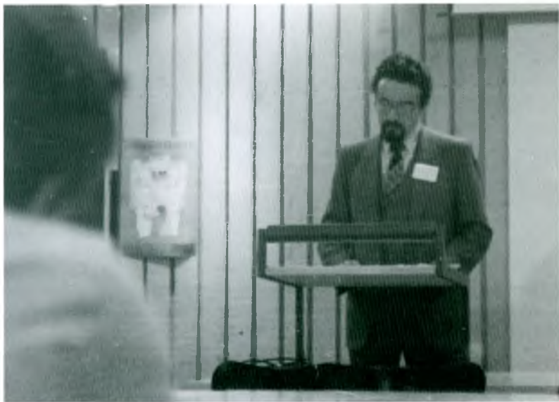
Копенгаген. 1988 год. Первое выступление на конференции за границей (VI конференция, посвященная изучению эскимосов)