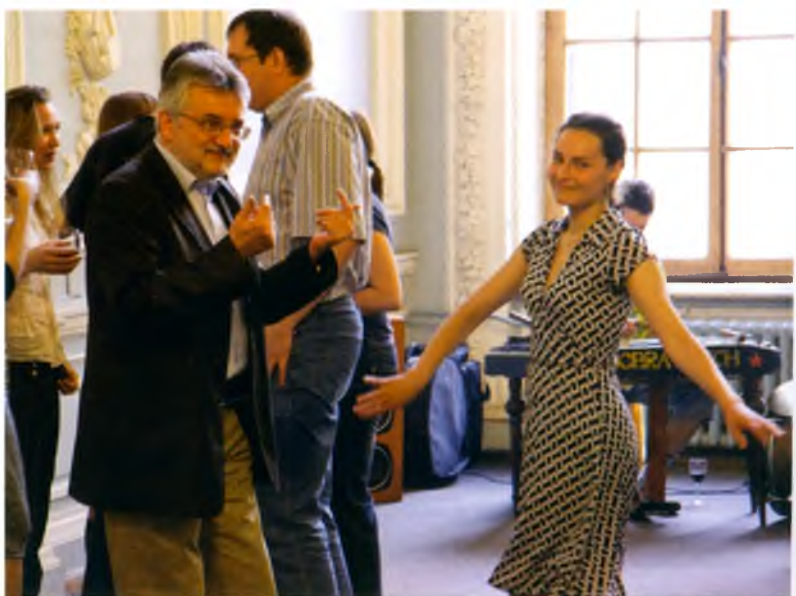
Отбой пожарной тревоги. 2008 год