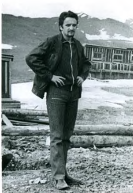
Первая экспедиция. Чукотка, эскимосское село Новое Чаплино. Лето 1974 года