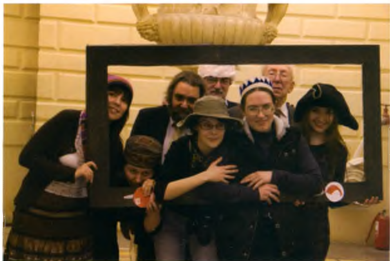
Пожарный фрейминг. 2008 год