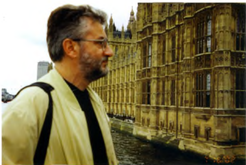
Англия. Любимая страна временного пребывания