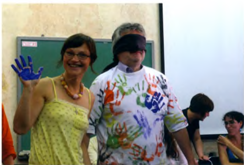
Возвращение на факультет: повторная инициация