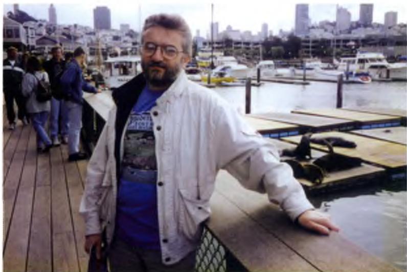
Морские котики водятся не только на Командорах. Сан-Франциско. Причал № 39