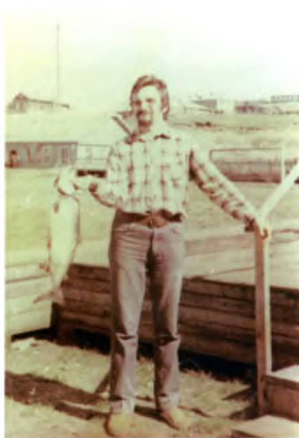
Лингвистическая экспедиция в село Никольское, Командорские острова. 1982 год. Наглядное пособие для изучения алеутской лексики: «рыба» по-алеутски называется к'ах'