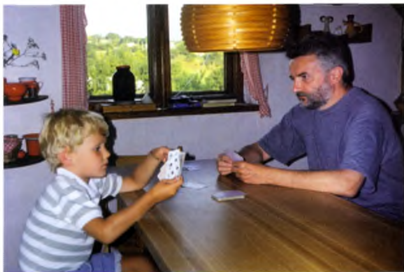
На даче в Шишаках (Полтавская губерния)