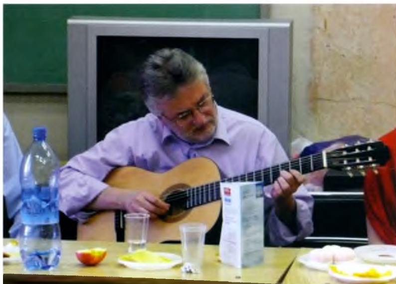
Гитара — подарок по случаю возвращения на факультет. ...А ручка не дрожит. 2009 год