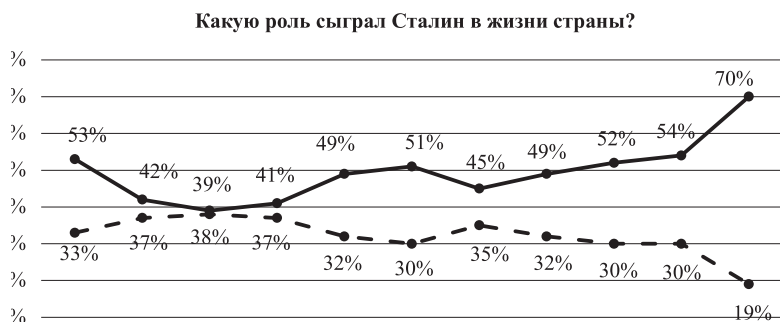
Рис. 3. Роль Сталина в жизни страны