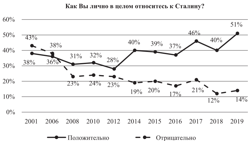
Рис. 2. Отношение к Сталину

плохо говорил про Сталина и относились к нему плохо; заговорил хорошо, и за 18 лет отношение радикально поменялось. И подтекст в такого рода рассуждениях следующий: вот если поменяется тональность телепередач на противоположную (хотя с чего бы?), то отрицательное отношение к Сталину снова возьмет верх.