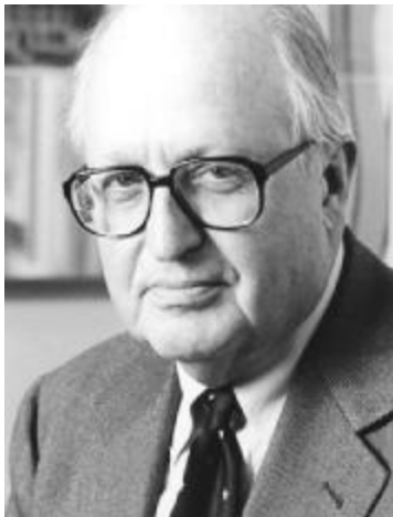
Henry Rosovsky, Harvard

“All the institutions at the top of the American educational pyramid... share six characteristics closely associated with high quality. Their absence would ... make it much more difficult for research universities to achieve the highest quality, not just in this country but anywhere else. Indeed, their partial or total absence abroad helps to explain why there are relatively few foreign—especially non-Western—institutions represented at the top of the accepted surveys. First, these institutions all practice shared governance ...”