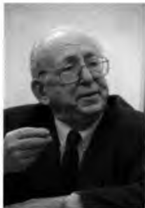
Речь на торжественном собрании, посвященном началу нового учебного года.