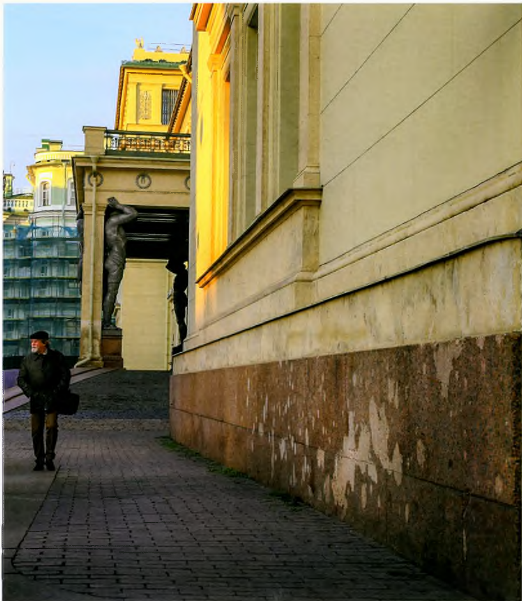
Повреждения цоколя здания Эрмитажа от взрыва снаряда рядом с портиком 18 сентября 1941 г. Фотография С. А. Маценкова. 2016

сентября. 8 сентября сомкнулось кольцо блокады. И в течение всей блокады, длившейся 882 дня, враг обстреливал город из артиллерийских орудий и бомбил с самолетов. В среднем на Ленинград ежедневно