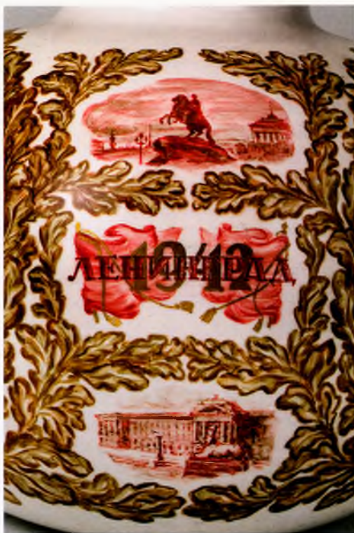
Ваза с изображениями видов Ленинграда во время Великой Отечественной войны. 1943. Фрагмент