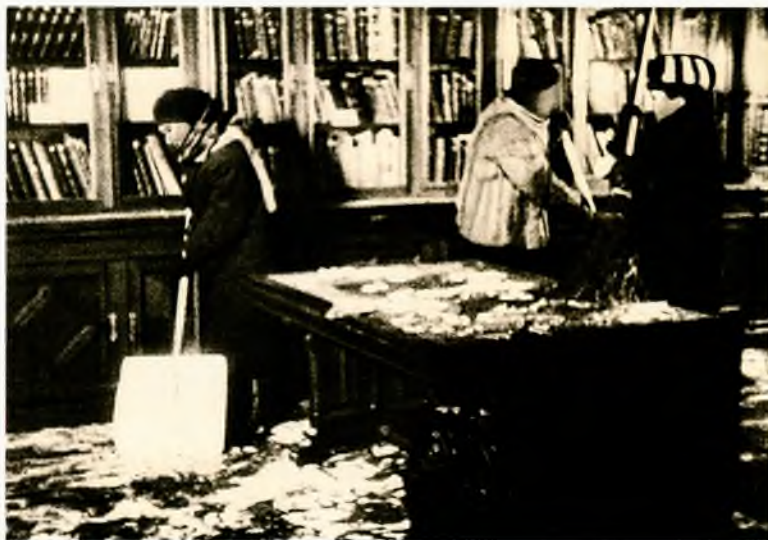
Сотрудники Эрмитажа в читальном зале библиотеки. Фотография. Государственный Эрмитаж