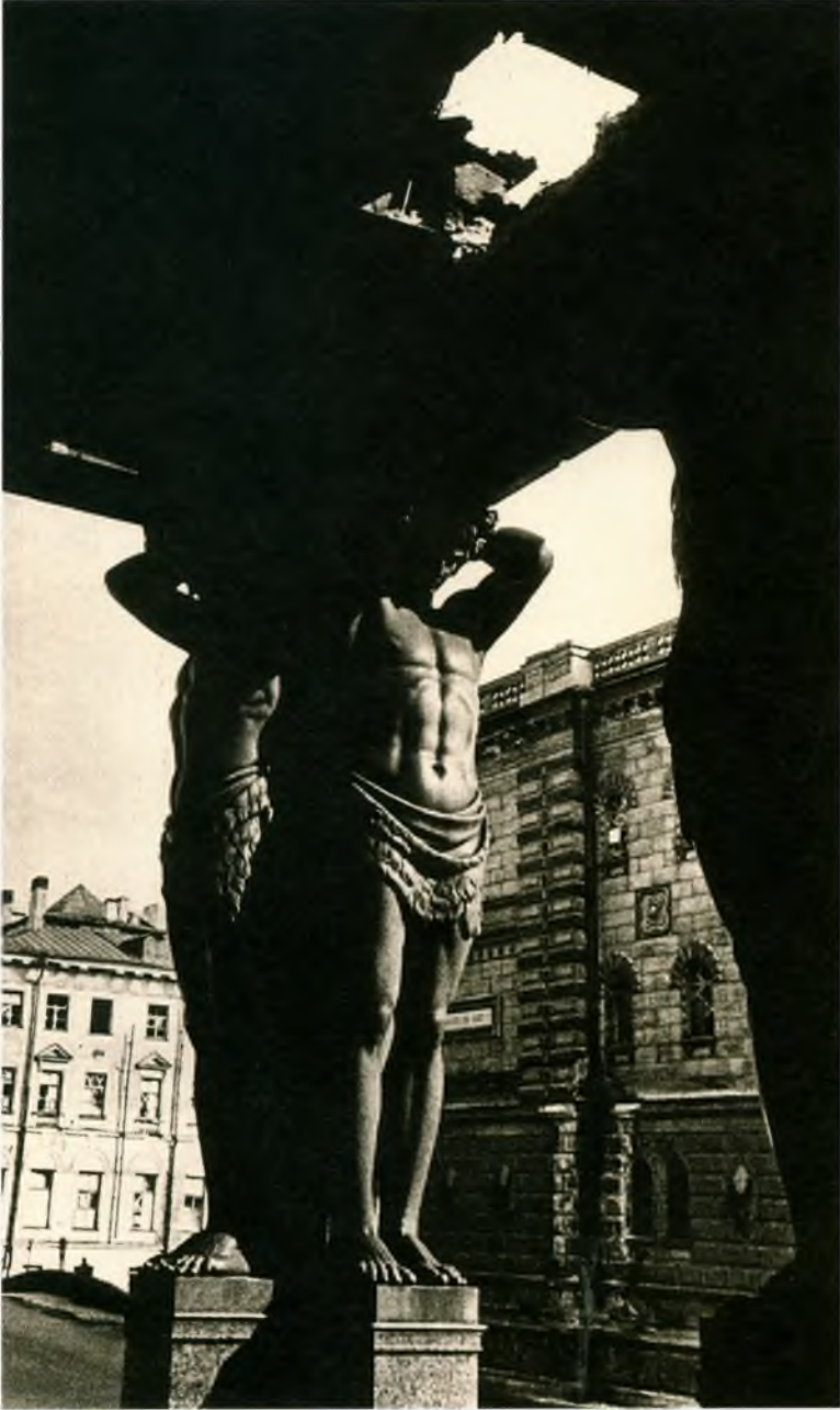
Повреждение портика с атлантами от взрыва снаряда 29 декабря 1941 г. Фотография 1942 г. Государственный Эрмитаж

людей в бомбоубежищах и культурные ценности в залах и подвалах. Кстати, стены и кирпичные перекрытия подвалов Зимнего дворца уже пережили тяжелое испытание в 1837 году, когда чудовищный