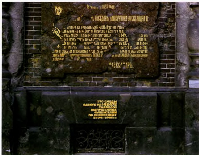
Мемориальная табличка на цоколе храма Спаса на Крови. Фотография С. А. Маценкова. 2016

мемориальная табличка: «Это следы одного из 148 478 снарядов, выпущенных фашистами по Ленинграду в 1941–1944 гг.».