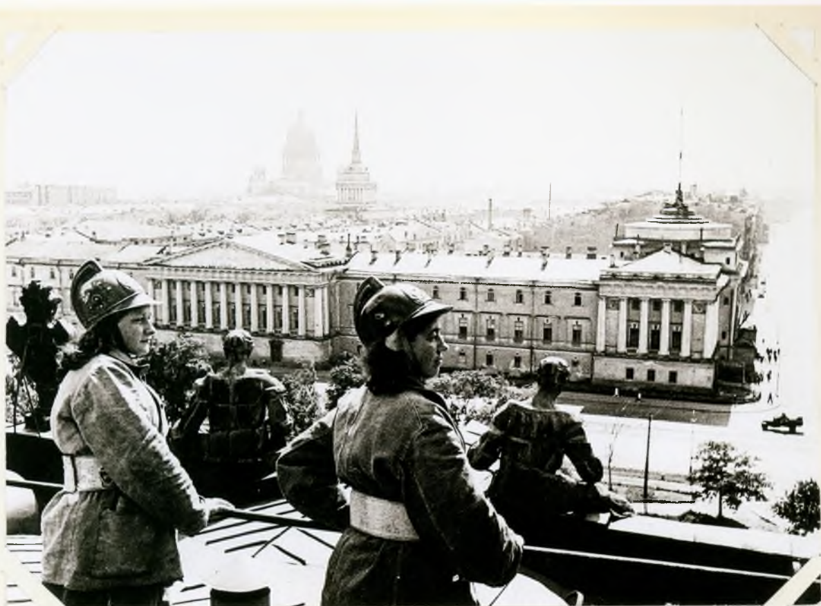
Сотрудники Гос. Эрмитажа дежурят на крыше Зимнего дворца.