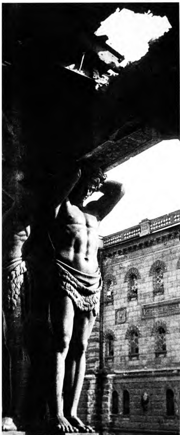
Пробоина в портике Халтуринского подъезда Нового Эрмитажа. 1942. Фрагмент