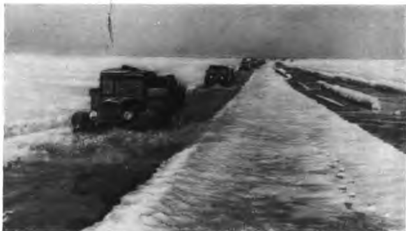
Весна 1942 года. Лед еще крепок, но перевозки с каждым днем становятся труднее.