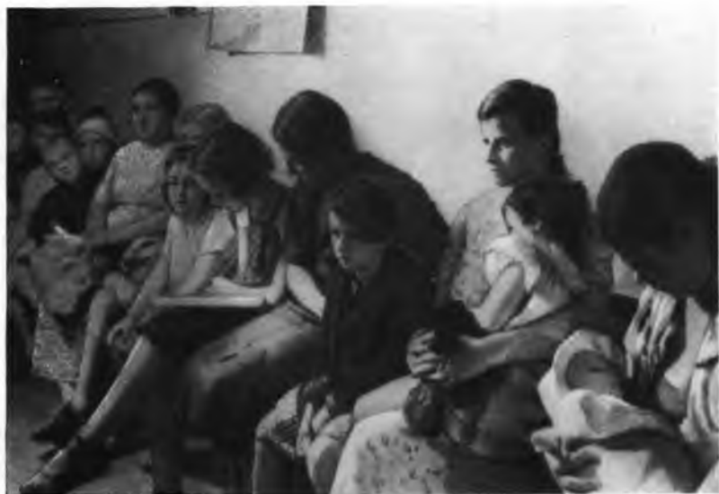
В бомбоубежище во время воздушной тревоги.