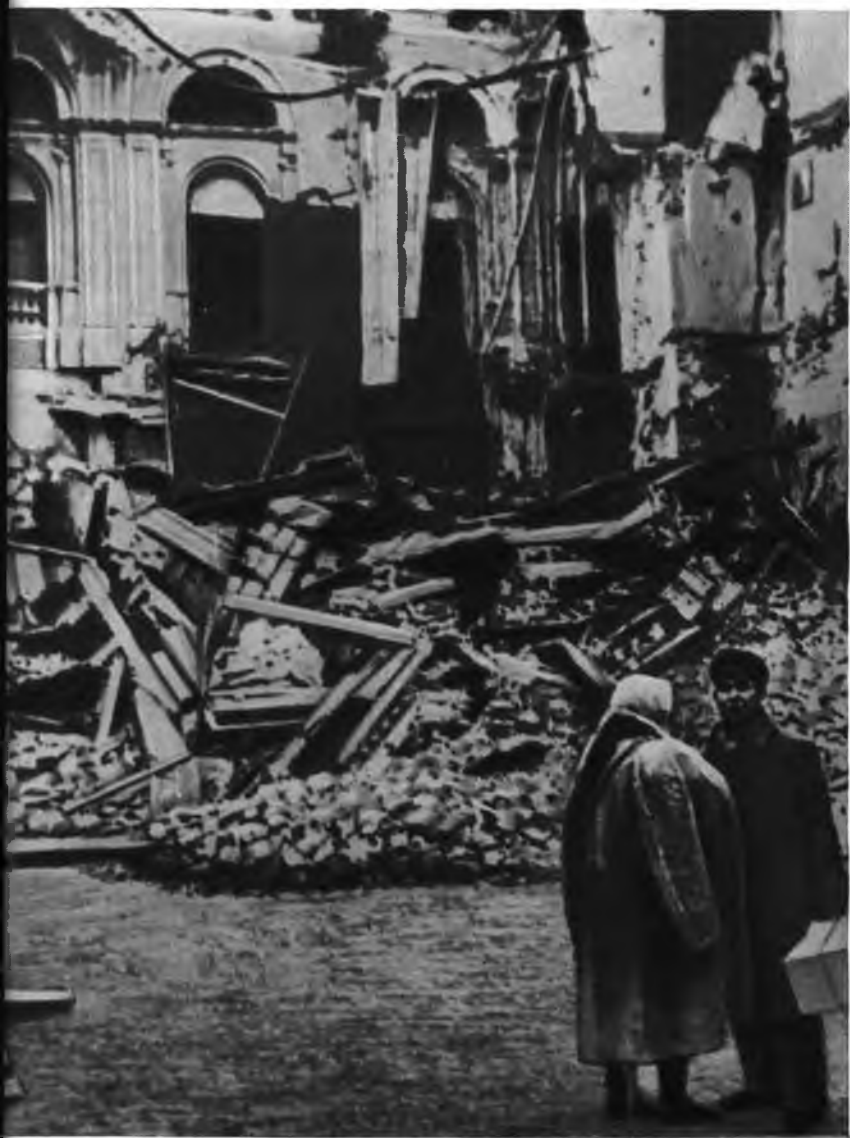
Здание Театра оперы и балета имени Кирова после бомбардировки.