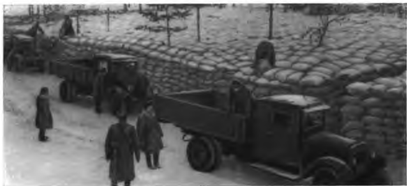
Кобона. Отсюда продовольственные грузы автотранспортом доставлялись на другой берег озера.