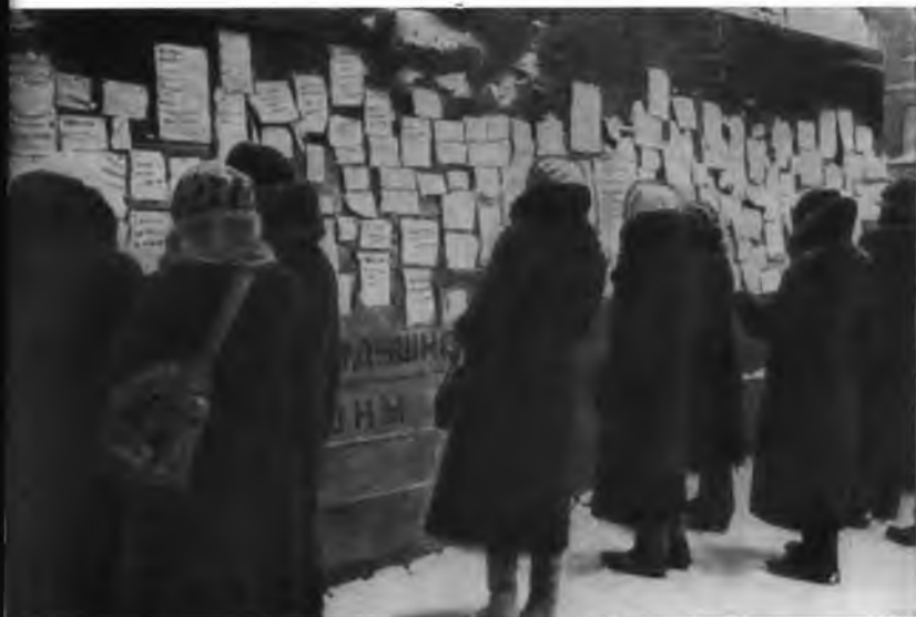
Февраль 1942 года. Объявления об обмене вещей на продукты.