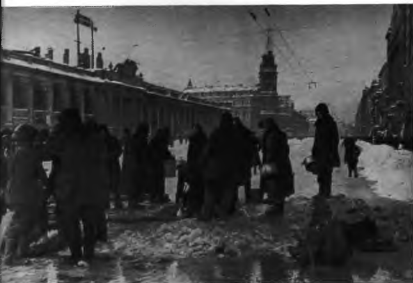
На Невском. 1942 год.