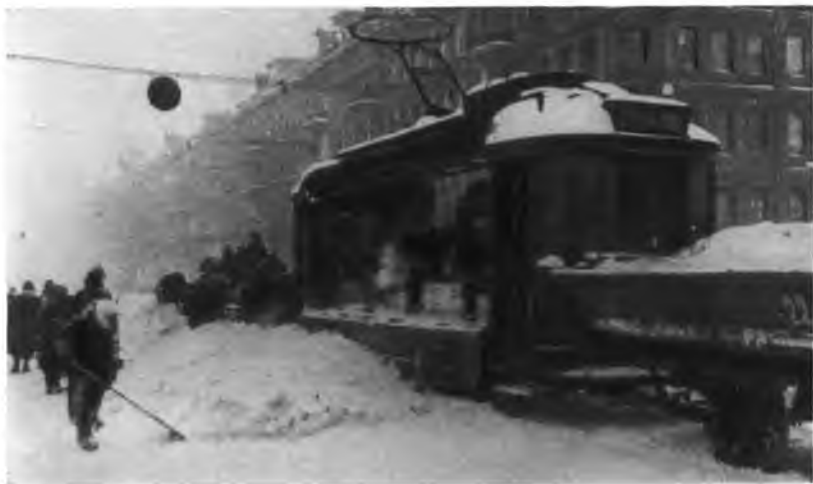
Возобновилось движение грузовых трамваев. На трамвай грузят сколотый лед.