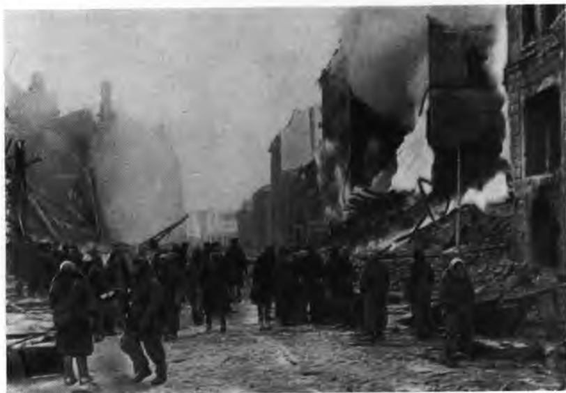
Население ликвидирует последствия бомбардировки.