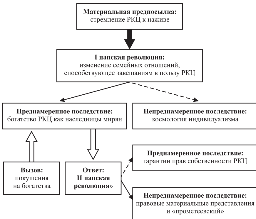
Рис. 3. Папские революции и их последствия