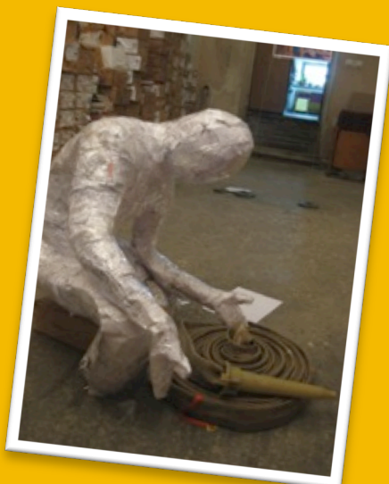
Фотовыставка, посвященная кризису

В ходе кампании было собрано более двух тысяч подписей под обращениями в защиту Европейского университета.