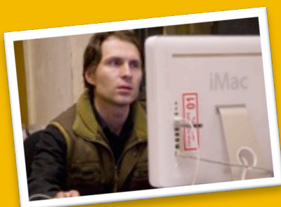
«Пуговка» - фильм, интерпретирующий события 2008 г.

В ходе кампании было собрано более двух тысяч подписей под обращениями в защиту Европейского университета.